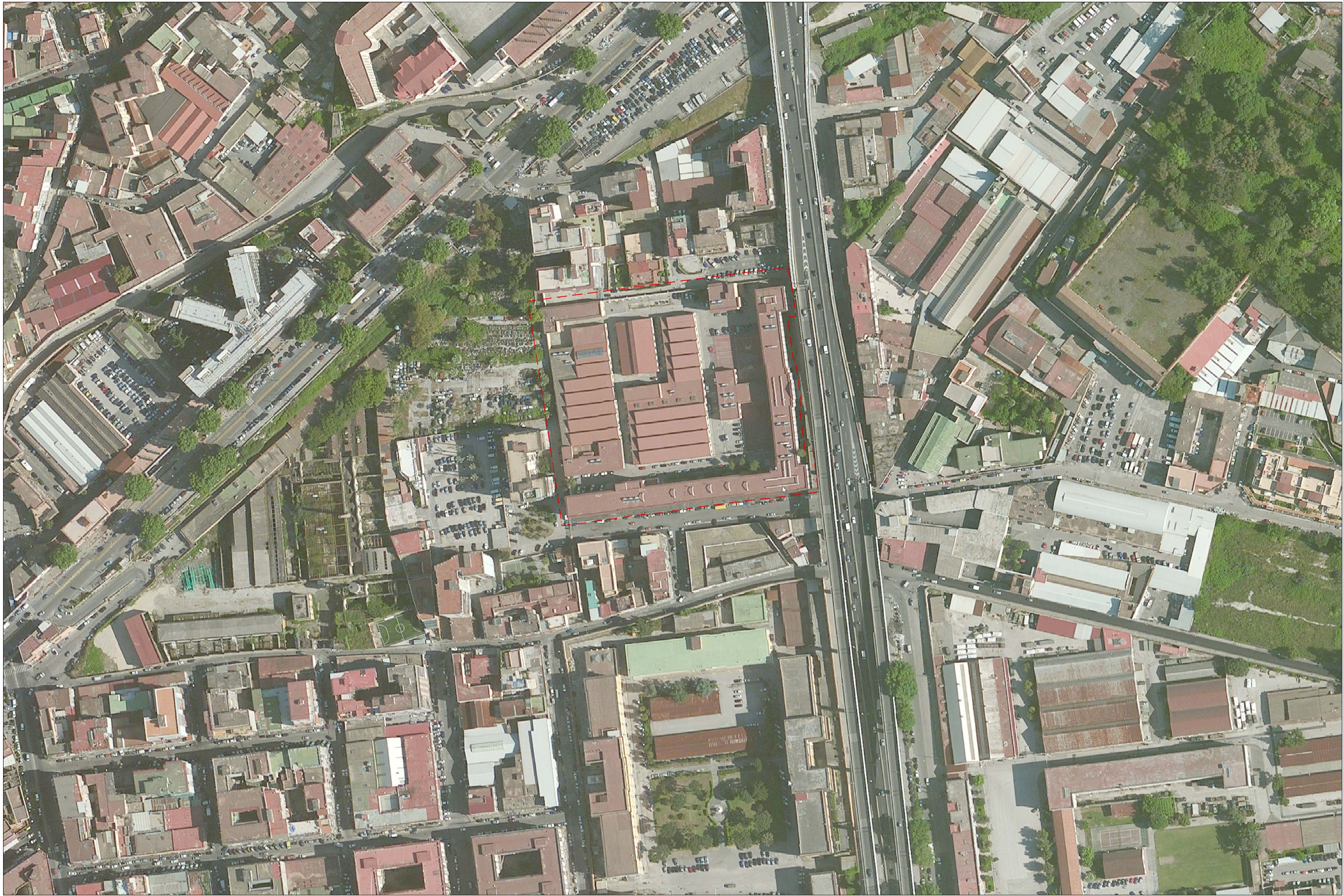
ORTOFOTO - Scala 1:2000